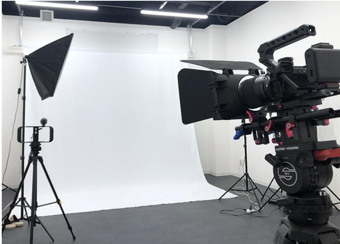
撮影スタジオ完備