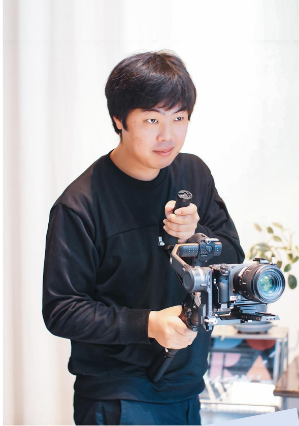
映像クリエイター