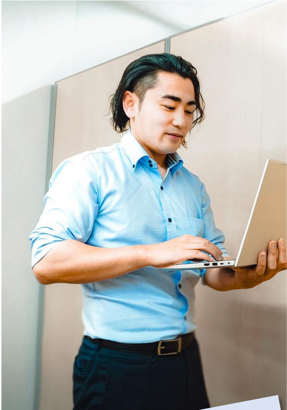
システムエンジニア プログラマ